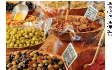
Mairie La Garde

€ Gratuit. ☎ 04 94 08 99 78 www.ville-lagarde.fr