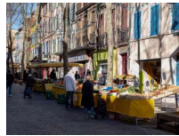
© Laurent Parient - Provence Méditerranée