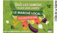
Mairie de La Valette

€ Accès libre. Marché de produits locaux et de qualité, provenant de la Valette et des alentours. Produits gourmands, huile, fromages caprins, miel, fruits et légumes, ... ☎ 04 94 61 90 51 - 0680180894